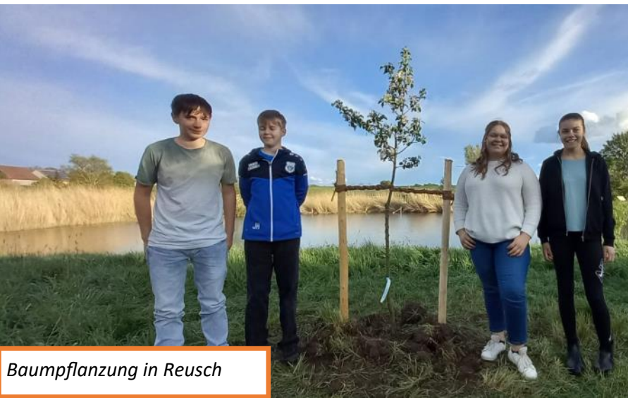
Baumpflanzung in Reusch