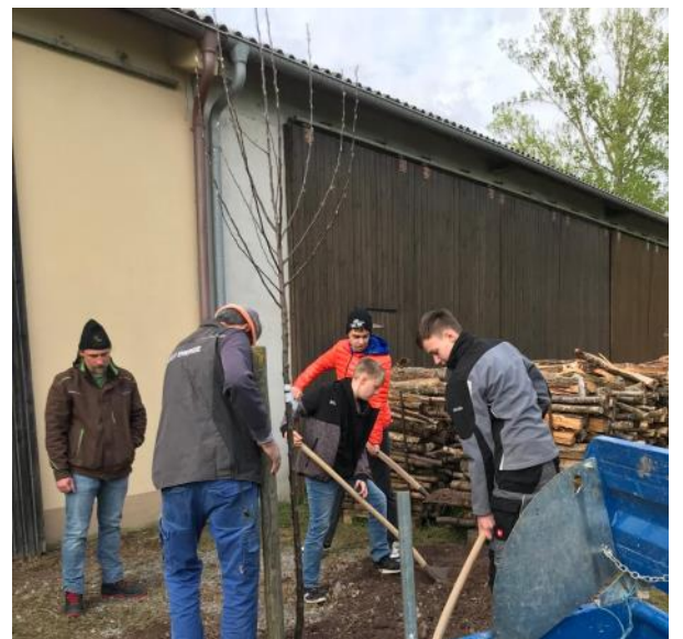
Baumpflanzung in Weigenheim

Wer auf Gott vertraut, „der ist wie ein Baum, gepflanzt an den Wasser- bächen, der seine Frucht bringt zu seiner Zeit, und seine Blätter verwelken nicht. Und was er macht, das gerät wohl.“ Psalm 1,3