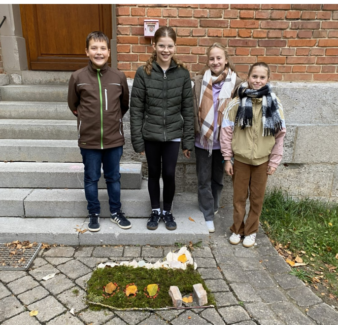
Präparanden bei einem ihrer Projekte